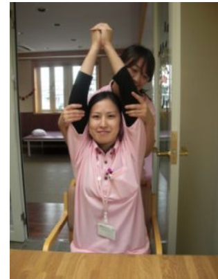
呼吸をしやすく発声量を増やす ための胸郭の拡大訓練の方法

また、摂食障害の方に対して、適切な食形態を判断したり、嚥下訓練を行っております。更に食事を摂っていただけるよう、口腔機能向上サービスの提供を行っています。