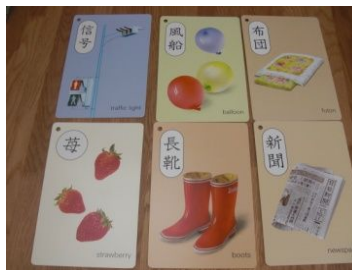
呼称訓練のカードと 訓練の様子