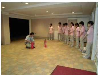
防災業者の指導による消火訓練

その他のスタッフは皆様が安全に避難できるよう介助誘導を行います。一時避難場所は隣の駐車場で、その後近隣の光が丘中学校に避難することになっております。