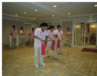
消火器の扱い方の実習